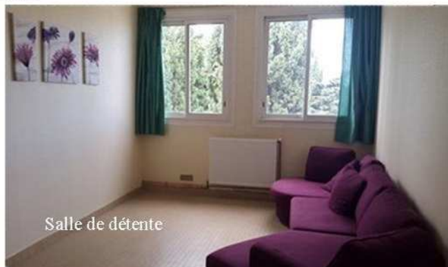
Salle de détente