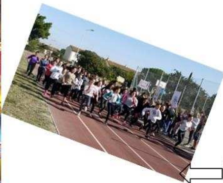
Cross du Collège

Etre interne c'est participer aux activités du Collège