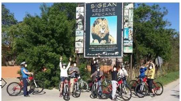
Balade VTT à la réserve africaine