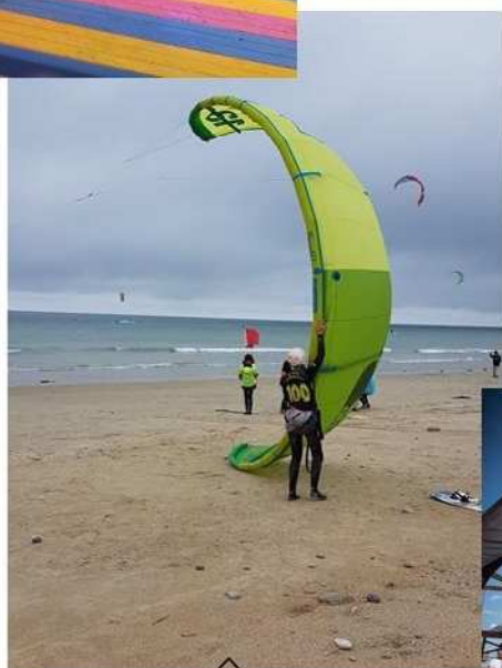
Pratique du Kitesurf

Etre interne c'est participer aux activités du Collège