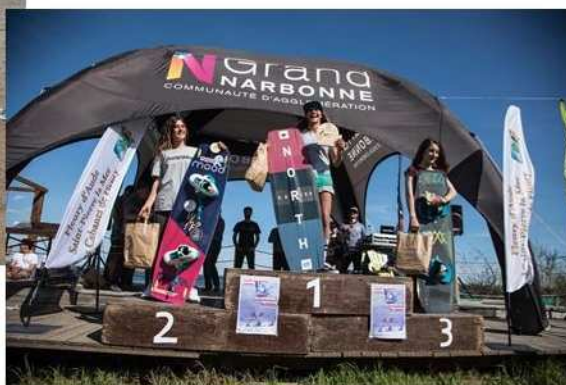
Championnat du monde de Kitesurf

Certains élèves internes au Collège de Sigean travaillent des disciplines sportives à un haut niveau : c'est le cas du Kitesurf où nous accueillons deux champions de France et une élève qui est arrivée troisième aux championnats du monde junior.